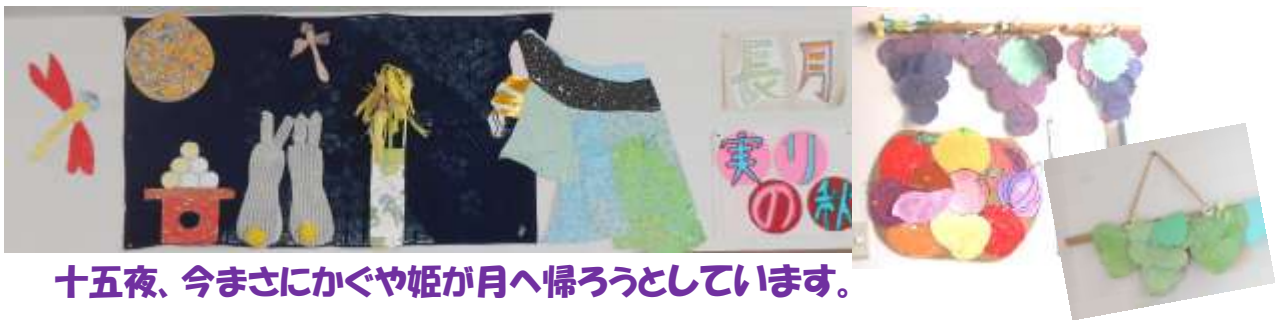
十五夜、今まさにかぐや姫が月へ帰ろうとしています。

残暑が少しずつ和らぎ始め、朝晩は涼しくなり過ごしやすくなってきました。栗や柿が色付き始め、赤とんぼの姿をよく見かけるようになりました。日中はまだ暑さが残っていますが、秋の気配も感じます。季節の変わり目は体調を崩しやすく、夏バテもこの時期に出やすくなります。体調管理に十分お気を付け下さい。