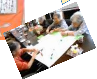
大作かぐや姫 に挑戦中！