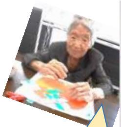
まさげな柿が できーじえ～