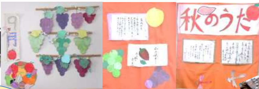
実りの秋&芸術の秋ですねえ～